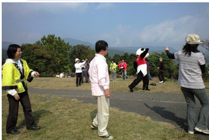
パンダさんも一緒に諫早のんのこ皿踊り