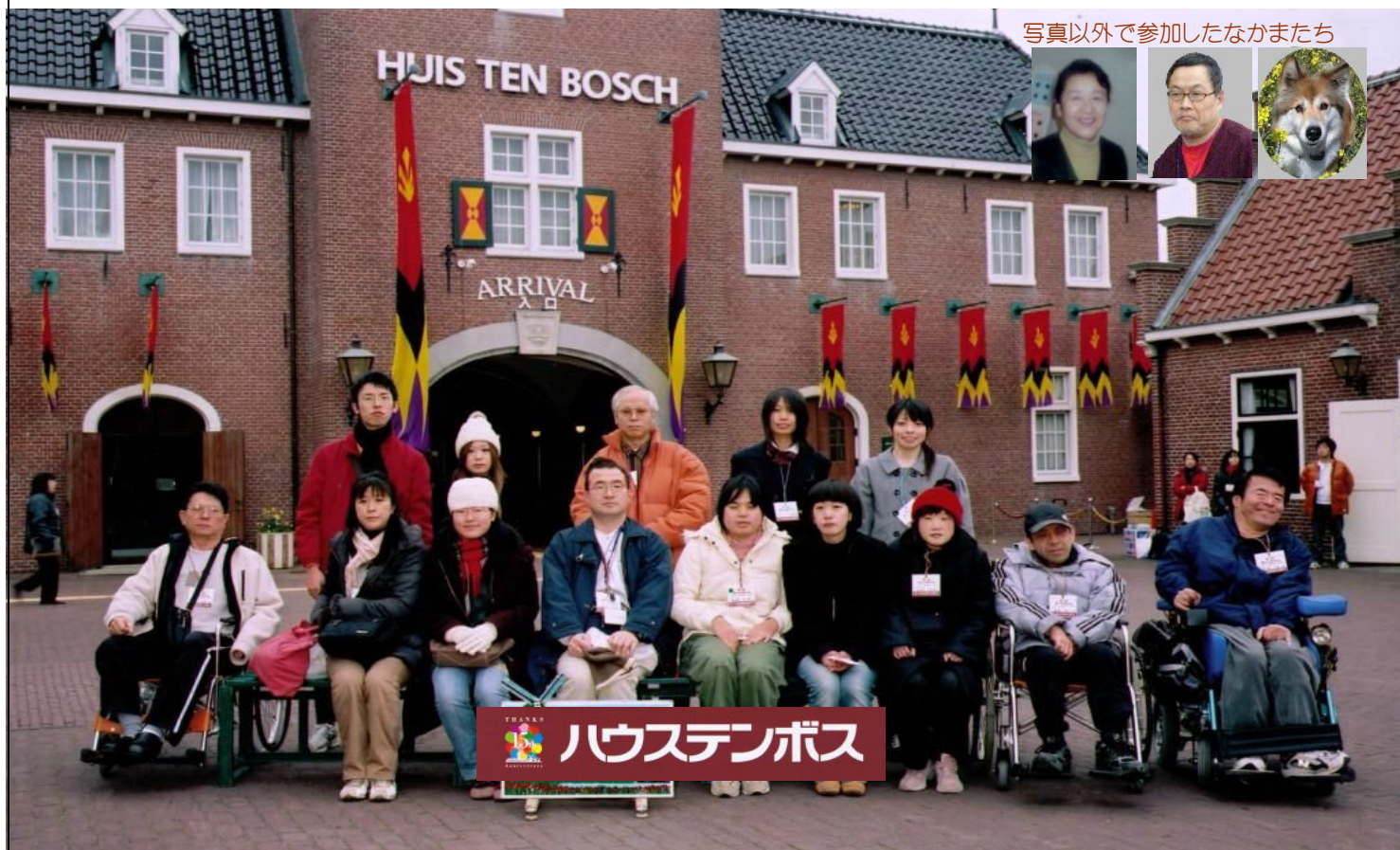
写真以外で参加したなかまたち