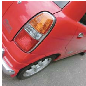
▲所用ですが、私のお気に入りの赤い車です。

ています。『私が職員なんて大丈夫かな？ でも今まで目標としていた生活保護を受けないで自立したいという願いが叶うチャンスだ!!』という気持ちの方が大きかったです。