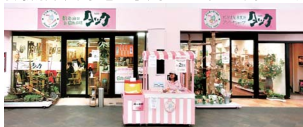
タックの右となりが、アンテナショップです。▲

〒854-0013 長崎県諫早市栄町3番22号栄町ビル1F (アエル栄町アーケード)