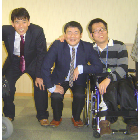
右端の車椅子にのっているのが筆者

私は、昨年の6月から手話の勉強をしています。私が手話を勉強しようと思ったのは、周りからの勧めもありましたが、自分自身も興味がありました。手話を勉強したら、もっと楽しみも増えるし、また新たな仲間とも出会うことができると思ったので、手話に挑戦してみようと思いましたが、でも最初は不安でした。自分に手話なんてできるのか？自分の手話が果たしてろうあの方に伝わるのか？という不安がありました。でも手話講習会に参加するたびに他の受講生の方とも仲良くなり、段々手話講習会に参加するのが楽しみでした。講師の先生方も優しく教えて下さったり、話しかけて下さいました。昨年の10月には手話検定を受検しました。5級ですが、なんとか合格することができたので嬉しく思っています。手話講習会に参加したことで、今ではほんの少しですが、ろうあの方ともコミュニケーションをとって話が通じ