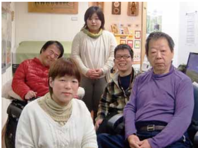
▲印刷部のなかまたち

私は、ドンキーワールドに通所して5年が経ちました。通所し始めたころは3人だった印刷部も、今では5人に増えて毎日楽しくみんなで協力し合いながら、仕事をしています。昨年からは、個人個人のパソコン技術向上のため、イラストレーターとフォトショップの所内講習会が開催されています。教わったことを多く習得できるように、がんばっています。