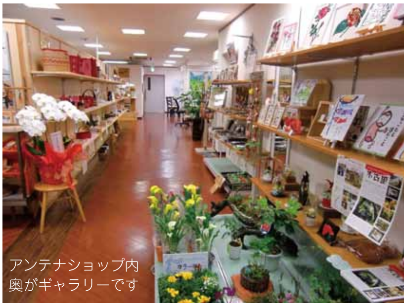
アンテナショップ内 奥がギャラリーです