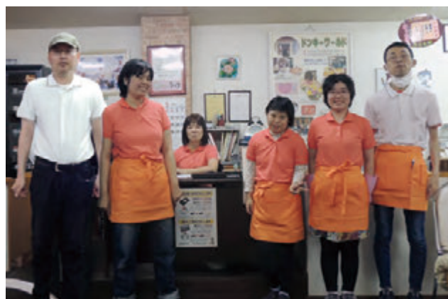
▲新しいユニフォーム