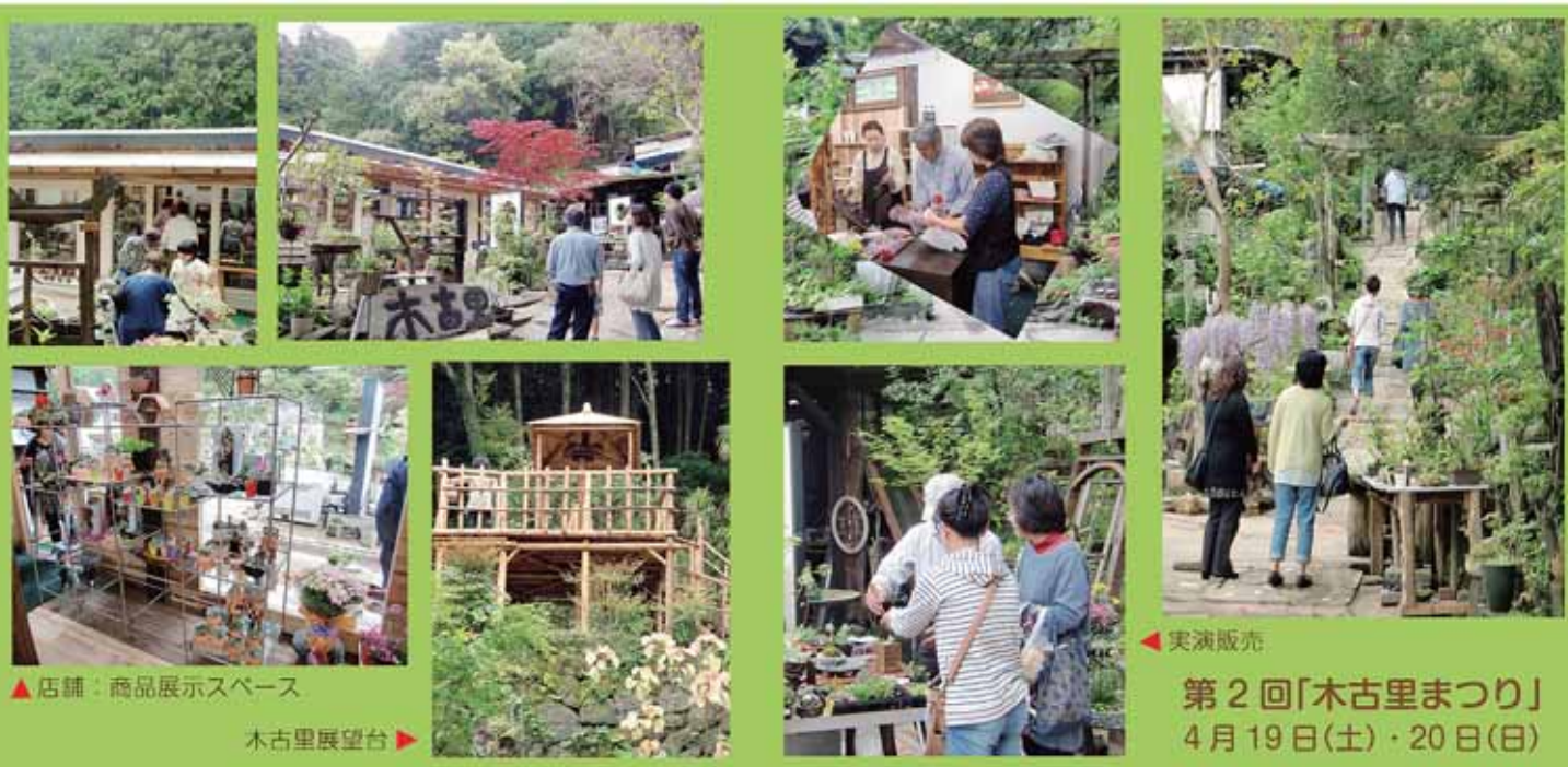
▲店舗：商品展示スペース