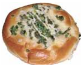
▲ねぎスペシャル 160円

クッキー は麦の食感がいい感じで、そのうえレーズンが甘酸っぱく口に広がります。しっとりとしていてとても好評です。