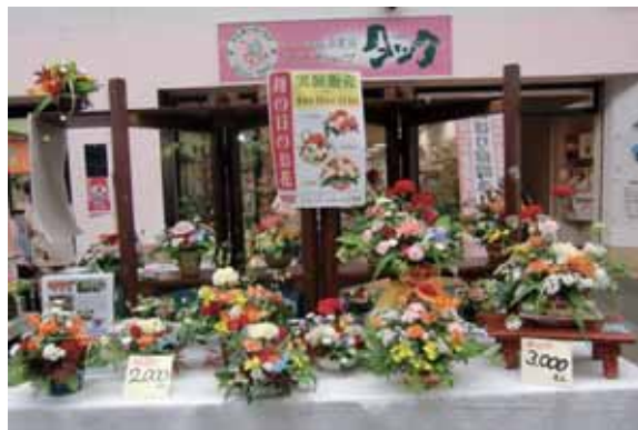
▲母の日のアレンジ花販売

今年前半、いろいろなことに取り組んできました。その中には、新しいチャレンジも生まれてきています。