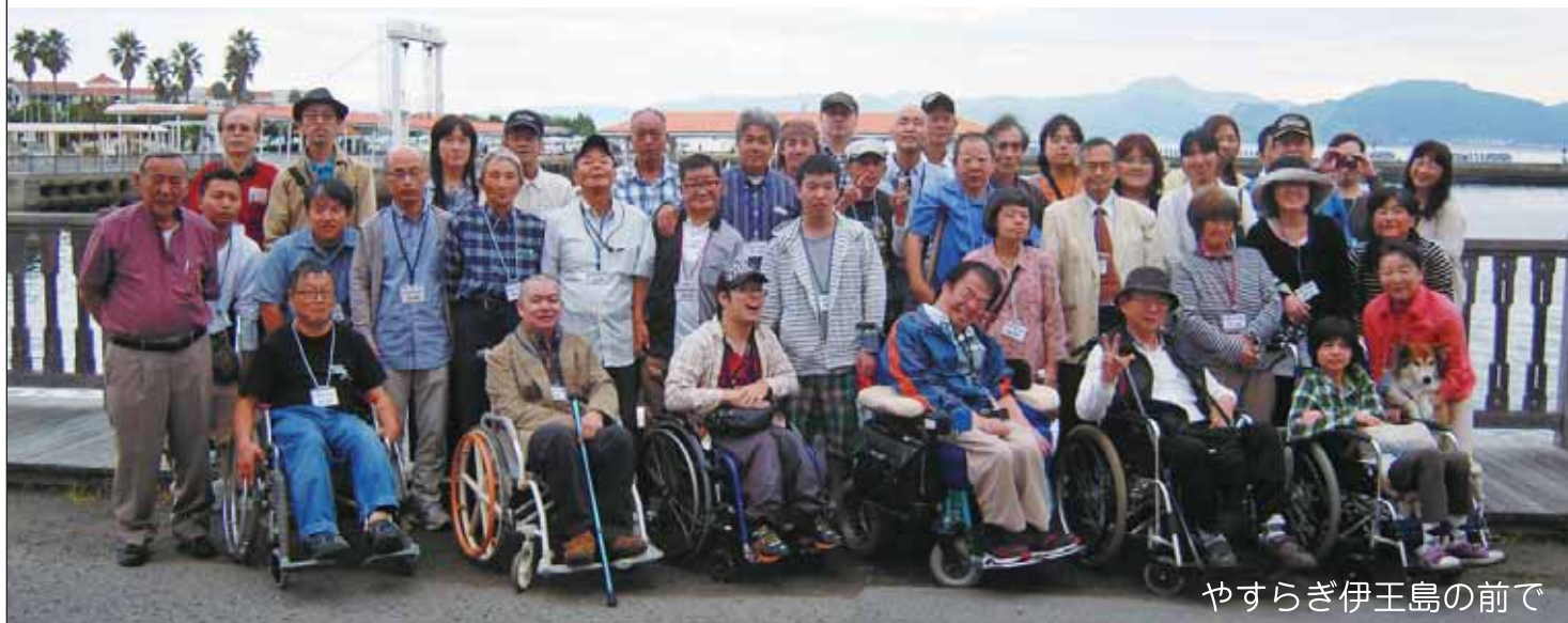
やすらぎ伊王島の前で