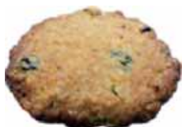
▲クッキー 1枚 120円

クッキー は麦の食感がいい感じで、そのうえレーズンが甘酸っぱく口に広がります。しっとりとしていてとても好評です。