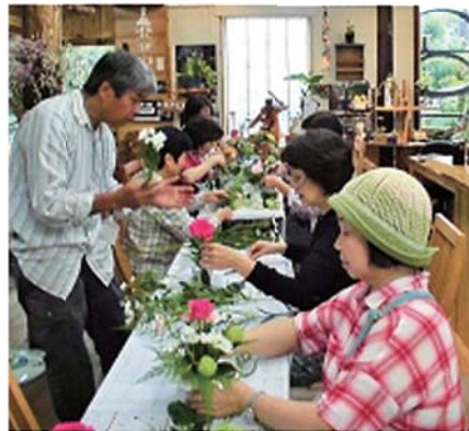
好評だった アレンジ