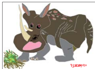
▲ ポストカード「サイ」