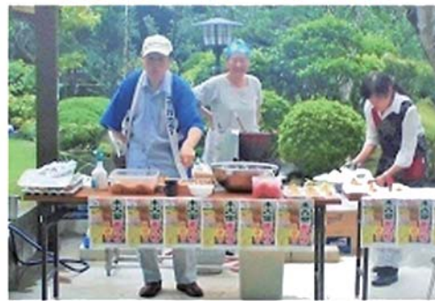
無料サービスコーナー