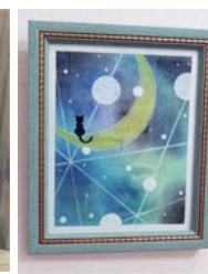
▲ パステル画「猫と月」