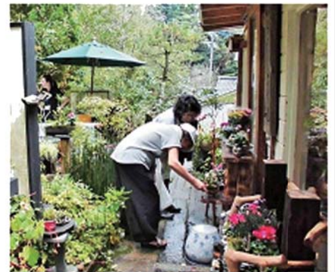
寄せ植えを選ぶお客さま