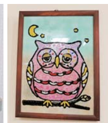
▲ デコグラス「ふくろう」