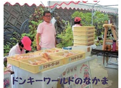
ドンキーワールドのなかま