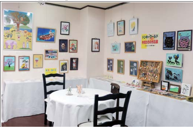
▲ ギャラリーの風景