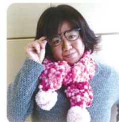
▲わたしがあんだまふらーです

6月1日より、ワークスペース木古里にかよっています。マフラーをあむのがとくいです。がんばります。よろしくおねがいします。