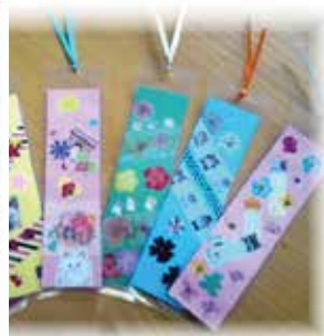
▲ネコシリーズのしおり