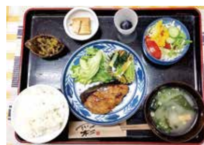
▲ B定食(ぶりの照り焼き)

軽食喫茶タックの日替わり定食は2種類あります。A定食は肉がメインで、B定食は魚がメインのメニューになっています。