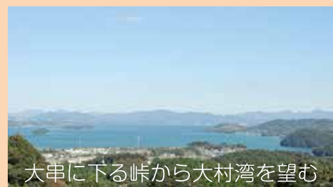
大串に下る峠から大村湾を望む

大村公園、波止付近でパチリ。ここにも白鳥がいた。しかもこの白鳥すごく人懐っこい。この後驚きの行動をする。ワンちゃんの散歩に一緒について行こうとした。見とれてしまってシャッターチャンスを逃してしまった。残念