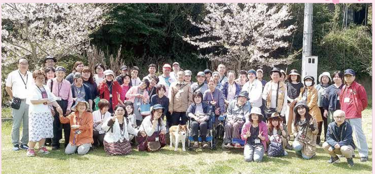
なかま交流会 2018年4月3日(火) ~潮井崎公園(長与町)~