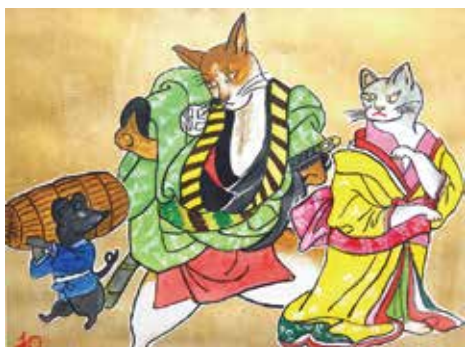
◀ 作：藤田 和世志 『太郎と銀』